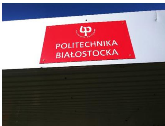
40 x 70 cm

Wydział Informatyki - 2 szt. j. polski i 2 szt. j. angielski