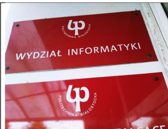
30 x 65 cm