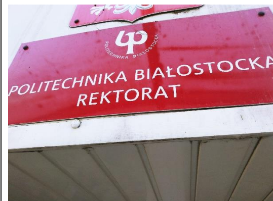
30 x 70 cm

Wydział Mechaniczny – 3 szt. j. polski i 3 szt. j. angielski