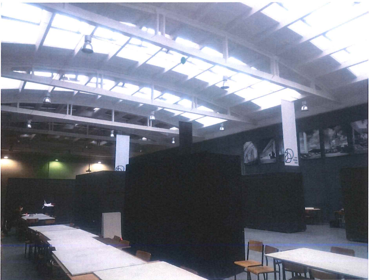
Hala Dydaktyczna Wydziału Architektury PB