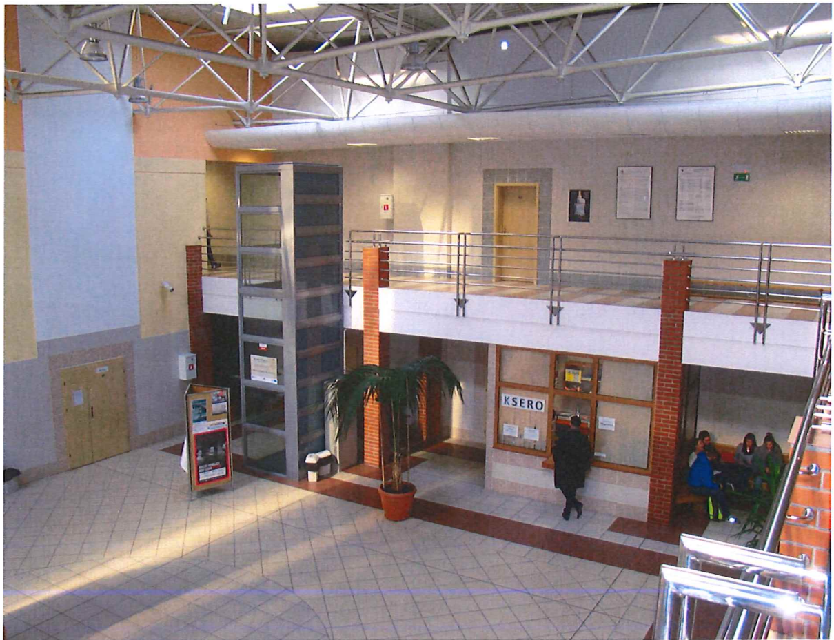
Hala Berlin Wydziału Inżynierii Zarządzania PB